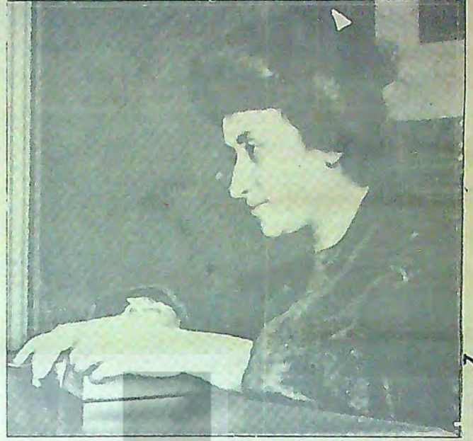
Rosa, yenildi. Ama devrimci onurundan hiçbirşey kaybetmedi.