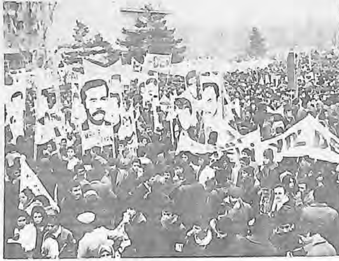
İşçi, köylü, öğrenci, tüm emekçi halkın kendi iktidarı için; hayatın her alanında mücadelesi sürüyor.

Faşist güçler, MC Hükümetinin düşme durumunun ortaya çıkmasıyla birlikte saldırılarını yoğunlaştırmaya başlamışlardır. Şimdi güven oylamasına doğru faşist güçlerin saldırıları genişleyen bir tempo içinde devam ediyor. Bu saldırıların devam etmesi beklenmelidir. Önümüzdeki dönemde de, emekçi halkımıza karşı alçakça tertip ve saldırı-